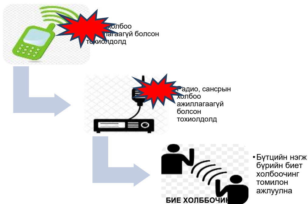
Зураг 2. Бие холбоочин ажиллуулах

8.4. Газар хөдлөлтийн гамшгийн үед бүх төрлийн холбоо тасарсан тохиолдолд бүтцийн нэгж тус бүр зарлан мэдээллийн бүдүүвчийн дагуу, хоёроос доошгүй бие холбоочинг томилж, хавсралт 1-т заасан бие бүрэлдэхүүний мэдээллийн дагуу зарлан мэдээлэл хүргэнэ.